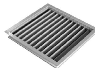
Aparat jest wyposażony w żaluzję nawiewną jednokierunkową Z1